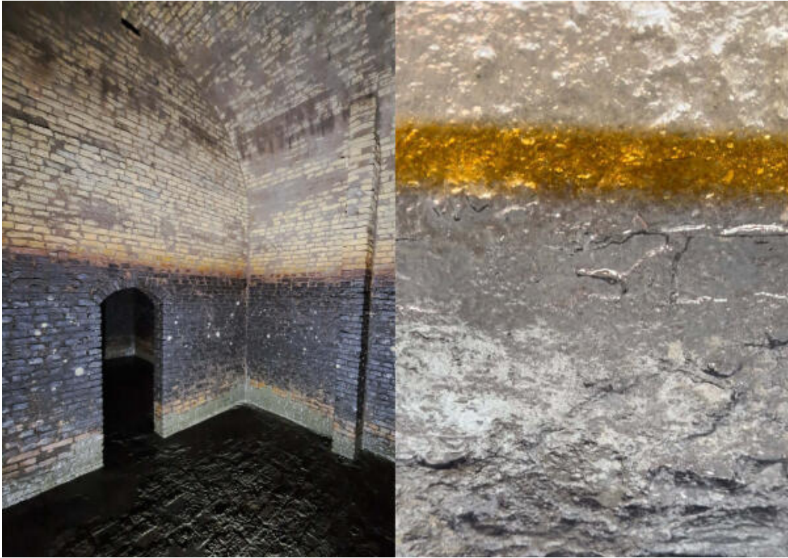
Links: Waterkelder Zuiderzeemuseum | Rechts: Artist impression werk Nynke Koster, In de stilte van de diepe waterkelder , 2026

De meest recente toevoeging aan deze collectie is het bijzondere object In de stilte van de diepe waterkelder van Nynke Koster (1986), gesitueerd in de binnentuin van het Schathuys. Haar werk verwijst naar de onder het kunstwerk gelegen historische waterkelders en is een afgietsel van de bakstenen wanden van één van deze ruimtes. De subtiele verkleuringen en de markering van het vroegere waterniveau zijn daarbij zorgvuldig zichtbaar gelaten. Met dit kunstwerk maakt Koster een normaal voor publiek ontoegankelijk deel van het museumcomplex ervaarbaar voor bezoekers. Het werk is uitgevoerd op circa 65 procent van de oorspronkelijke schaal en gaat door de materiaalkeuze en toevoeging van audio een bijzondere dialoog aan met de ruimte.